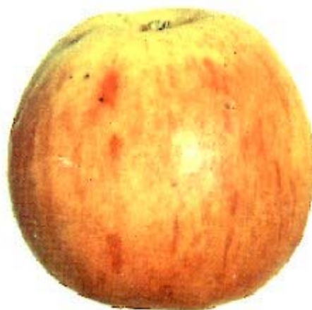
RAMBAULT Fichier© 2001-choisel j.l.